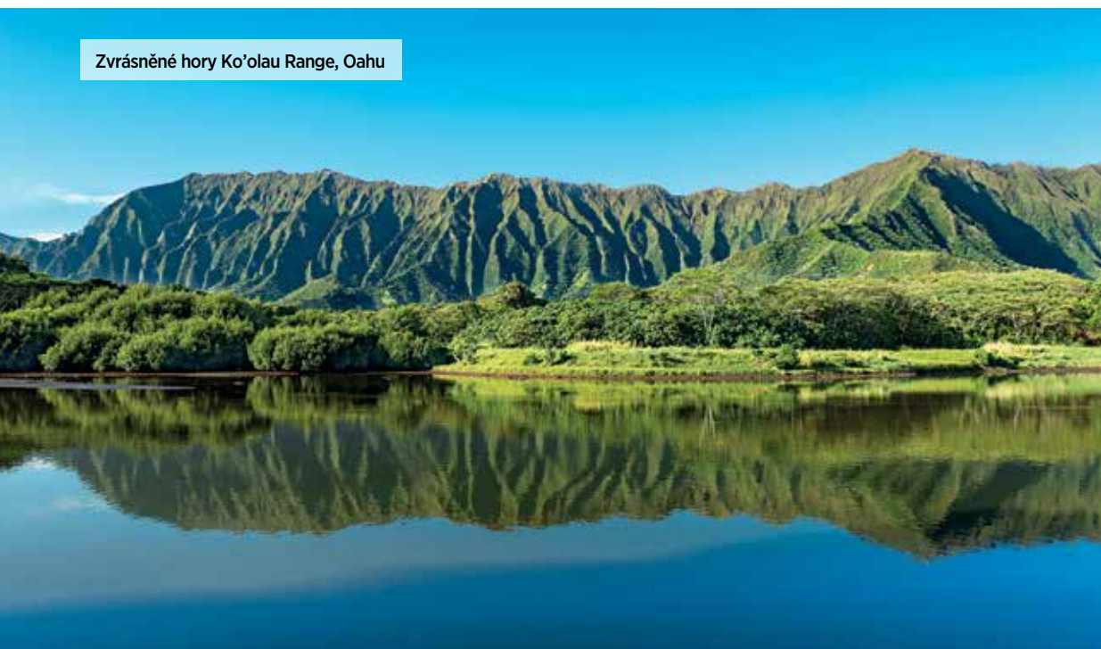
Zvrásněné hory Ko'olau Range, Oahu