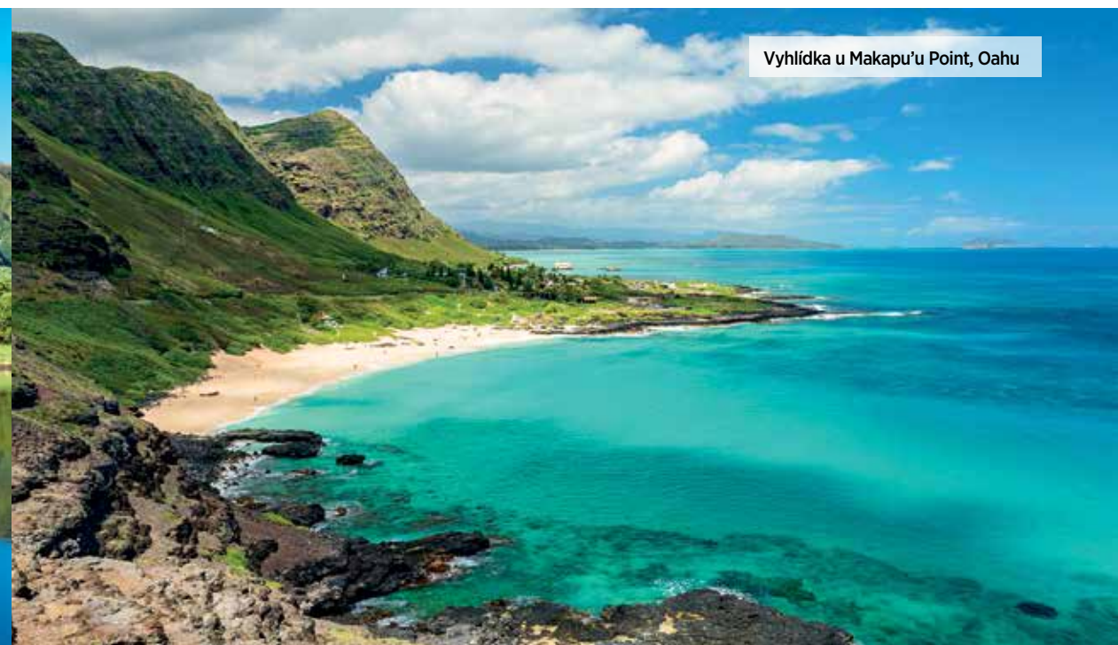
Vyhlička u Makapu'u Point, Oahu