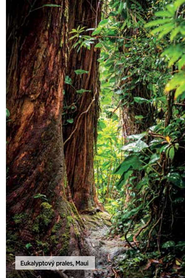
Eukalyptový prales, Maui

Pravý havajský relax si na Maui dopřáváme na východním pobřeží. Wailea, Kihei, Lahaina nabízejí nádherné pláže podle přání návštěvníků od typu resortů až po téměř panenské pláže s minimem lidí. Každý si přijde na své. Maluaka a Ma'alea Beach u nás