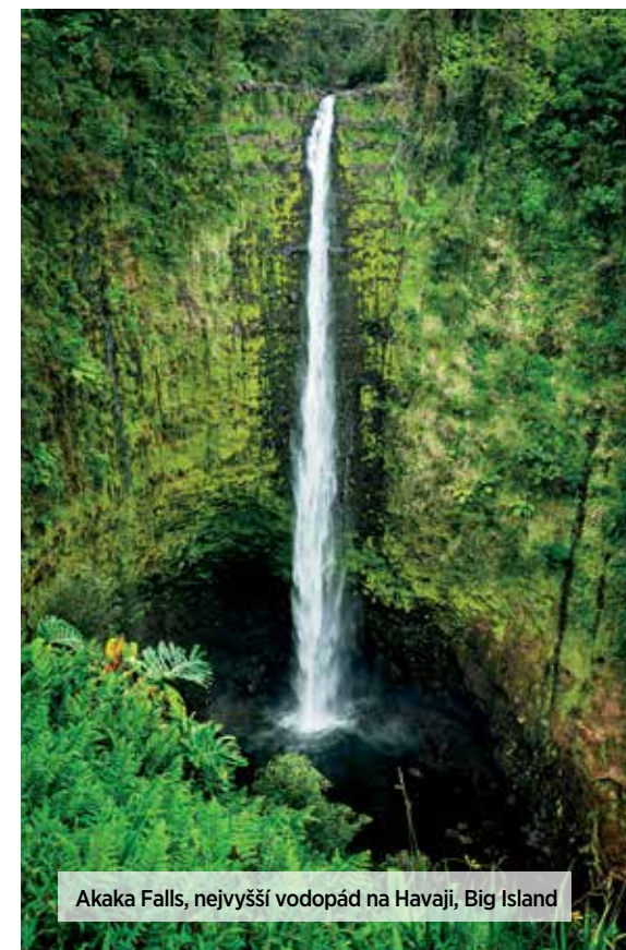
Akaka Falls, nejvyšší vodopád na Havaji, Big Island

Havajské vulkány jsou nádherným národním parkem, kde můžete na vlastní oči zblízka pozorovat, jak vzniká nová země. Kráter Kilauea, nejaktivnější sopka světa a podle havajské mytologie sídlo bohyně ohně Pelé, sice v době naší cesty spí, v rozlehlém parku se ale potkáváme s pozůstatky jeho činnosti na každém kroku. Procházíme upravenými a dobře značenými stezkami, průduchy ze země okolo kouří horkými a sirnými výpary. Na mnoha místech, kde už zvětralá láva vytváří tu nejúrodnější půdu, rostou tropické keře a rostliny se záplavou květů. Poznáváme ježaté ohie, ibišky a orchideje. U návštěvníckého centra nasedáme do auta a jedeme po 18 mil dlouhé silnici Chain of Craters Road až na její konec, jižní břehy Big Islandu, kde se lávová pole a útesy potkávají s oceánem. Cesta se klikatí lávovými poli, z nichž některá ji v minulosti na mnoha místech přežala. Taková místa jsou označena cedulkami s letopočtem, ve kterém roce se tudy láva převalila. Míjíme také zkamenělé stromy, němé svědky sopečného řádění v této bizarní krajině. U jižního