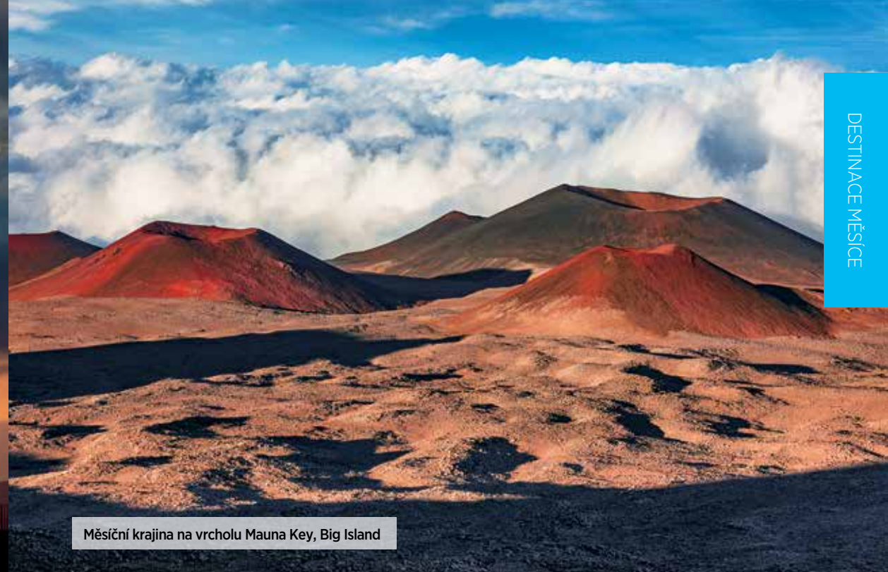
Měsíční krajina na vrcholu Mauna Key, Big Island

Big Island jsou hlavně havajské vulkány, lávová pole, na druhou stranu ale i deštné pralesy, skvělé pláže, kávové plantáže a místa, která se vážou k havajské historii. V jednom