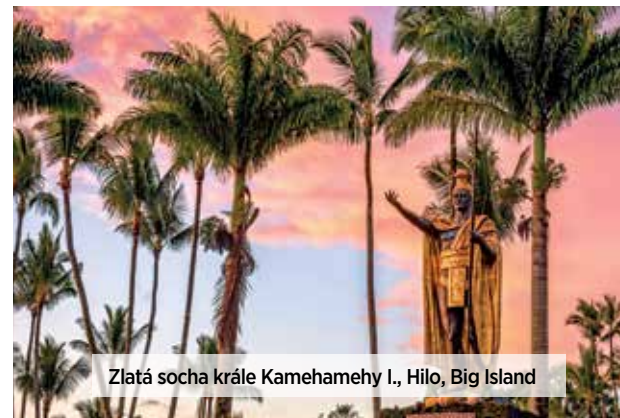
Zlatá socha krále Kamehamehy I., Hilo, Big Island

Naše cesta pro dnešek míří o poznání výš, měl by to být vrchol putování po Big Islandu. A to vrchol doslova, protože míříme na střechnu Polynésie, na vrchol hory Mauna Kea. Tato vyhaslá štítová sopka je se svými 4205 metry nejvyšším bodem Havajských ostrovů. Je také nazývána střechnou nebo Korunou Polynésie, a pokud bychom její výšku měřili od úpatí až po vrchol, pak by se svými 10 200 metry byla také nejvyšší horou světa. Tolik trochu zeměpisu a my už jedeme z Hila po Saddle Road až na vrchol Mauna Key. Pro tentokrát se musíme také výjimečně přiblížit, v kufru auta máme s sebou vrstvy termoprádla, dlouhé kalhoty, pěřovku, čepici a rukavice. Překonat