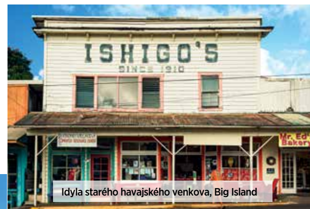
Idyla starého havajského venkova, Big Island