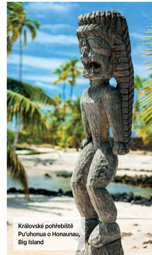
Královské pohřebiště Pu'uhonua o Honaunau, Big Island