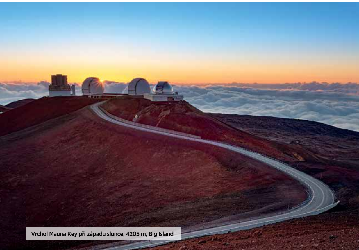
Vrchol Mauna Key při západu slunce, 4205 m, Big Island

výškový rozdíl čtyř tisíc metrů za 1,5 hodiny je pro náš organismus obrovská zátěž, proto dáme na doporučení místních rangerů a děláme povinnou 3/4hodinovou zastávku v návštěvnickém centru ve výšce 2600 metrů, abychom se rozdýchali a přiblížili si připravené oblečení. Když konečně dorazíme na vrchol, úbytek kyslíku je okamžitě cítit. Plánuji tu zůstat více než hodinu, chci fotografovat západ slunce na vrcholu hory s futuristickou kulisou budov hvězdáren a teleskopů. Okolo z krajiny vystupují sopečné kužely, zbarvené do rudooranžova v podvečerním zlatavém slunci. Několik set metrů pod námi se rozlévá moře z hustých mraků. Atmosféra jako z jiné planety. Chvilí poté, co se slunce dotkne horizontu, nás ranger žádá, abychom opustili vrchol Mauna Key, aby vědci mohli nerušeně provádět pozorování noční oblohy a nebyli při tom rušeni světly automobilů. Havajská Mauna Kea má ideální podmínky pro tato pozorování pro svou nadmořskou výšku, vhodné klima a čistý vzduch bez prachového, a především světelného znečištění.