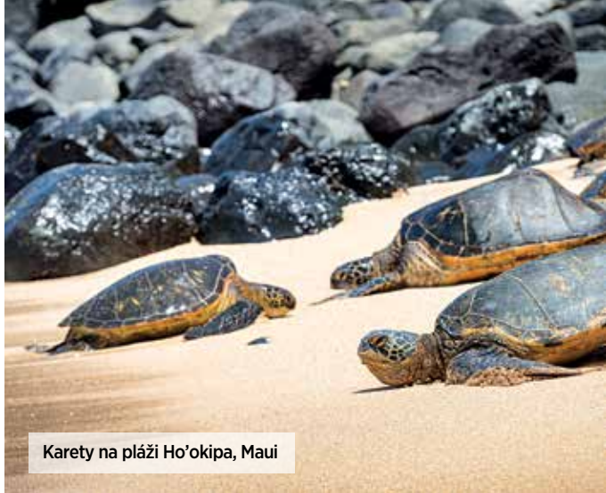
Karety na pláži Ho'okipa, Maui