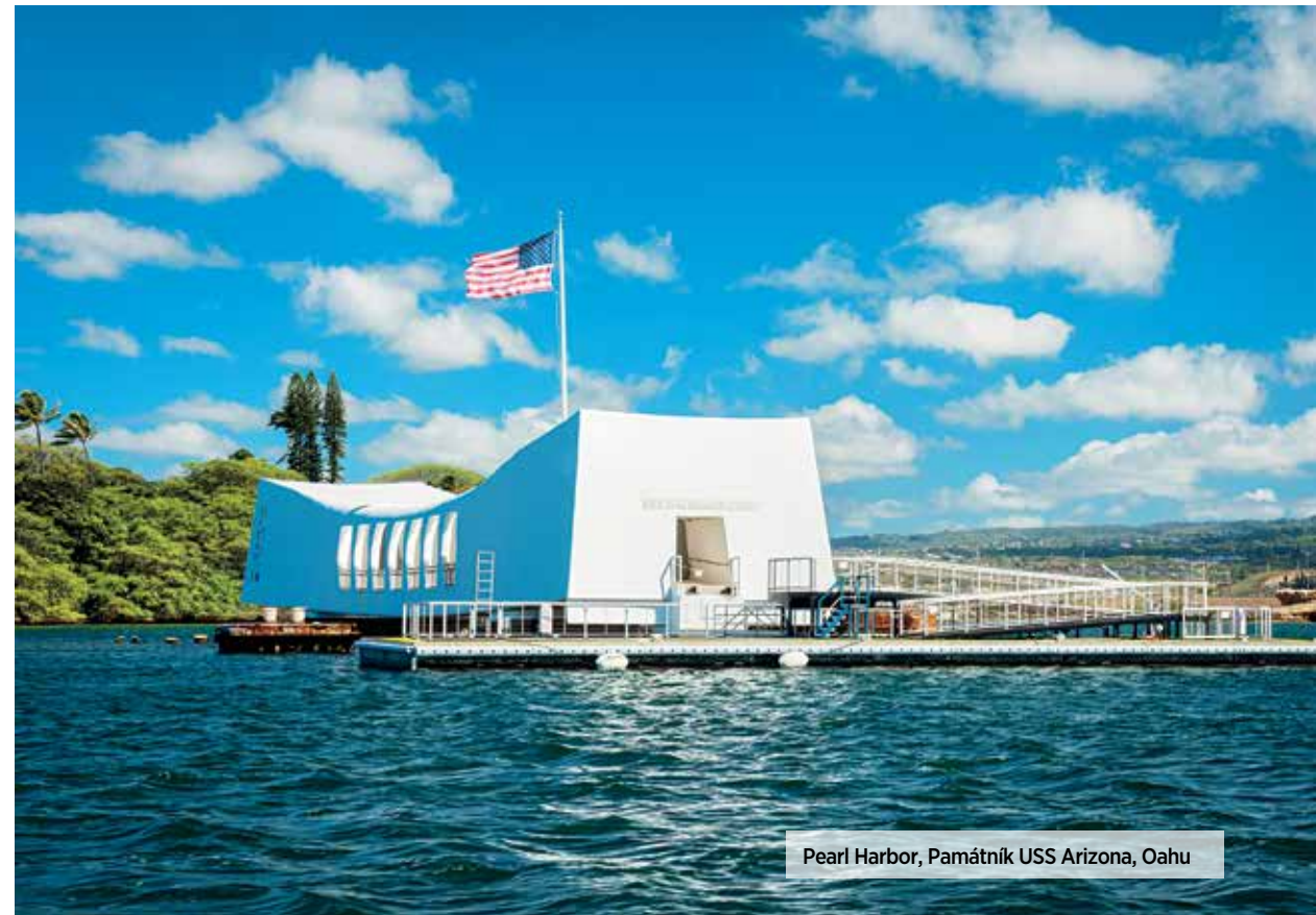
Pearl Harbor, Památník USS Arizona, Oahu

Stáčíme se na sever, míříme na North Shore. Severní pobřeží Oahu je Mekka surfařů. V období prosince a ledna tu bývají největší vlny a koná se tady mistrovství světa v surfigu. Teď je sice po hlavní sezoně, nicméně surfařská subkultura tu žije pořád. Centrem dění je městečko Haleiwa, kde ještě stále můžete nasát atmosféru staré Havaje. Staré stylové dřevěné domky, obchůdky a půjčovny surfařského vybavení. Mnohé patří samotným místním surfařům, z nichž někteří jsou