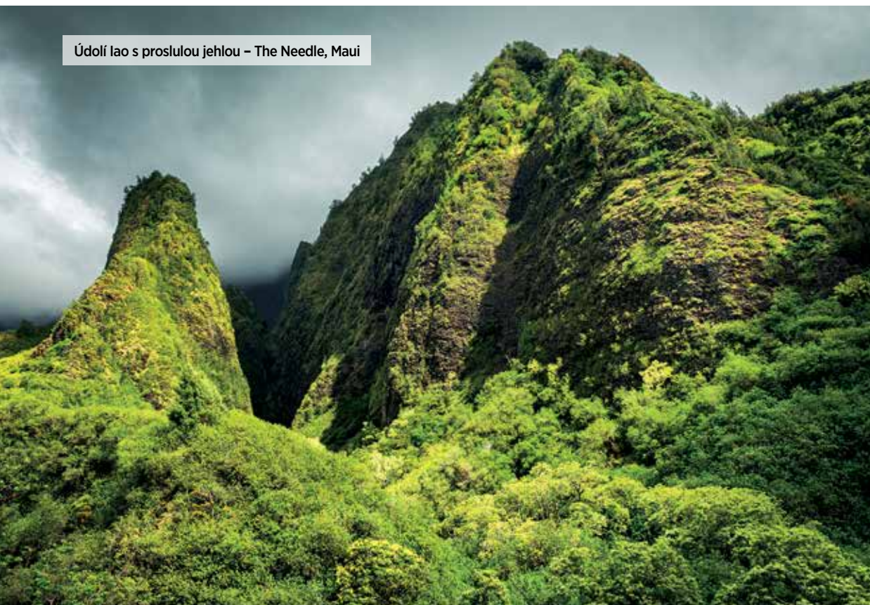
Údolí Iao s proslulou jehlou – The Needle, Maui