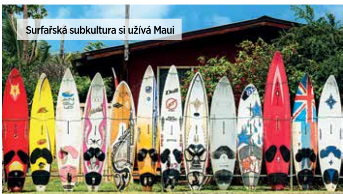
Surfařská subkultura si užívá Maui

Jak už jsem řekl, Havaji se nic nevyrovná. I když to může znít jako klišé a já si na klišé moc nepotrpím, hlásím se k tomu. Všemi smysly. Jsem Havají naprosto pohlčen. Přesto, že jsem viděl jen malý zlomek toho, co tento skutečný zemský ráj nabízí. A jsem přesvědčen, že každý návštěvník, každý cestovatel si na Havaji najde to své. U mě zvítězily nádherné krajiny a příroda, pro jiného to budou milí, pohodoví a usměvaví lidé, další bude rád relaxovat na plážích. Anebo ochutnejte od všeho trochu. Už při odletu z Havaje je mi smutno a vím, že se sem do ráje chci zase podívat. ◀