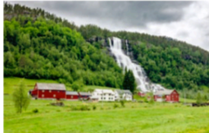
Norsko – vodopád Tvindefossen

a neekonomičtěji se dostat na místa, kde chci fotografovat. Co se týká finančních prostředků, tak cestování s fotografováním dávám prioritou. Většinu peněz, které vydělám, jdou právě na ně.