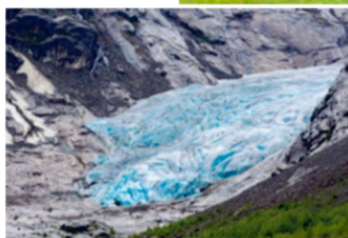
Norsko – ledovec Nigardsbreen