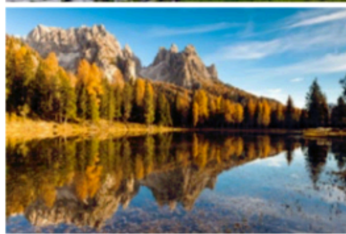
Dolomity – moje srdeční záležitost, jezdím tam každý rok na podzim a v zimě