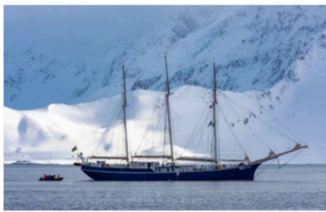
Špicberky – polární expedice

Knížka je členěna do tří částí a čtenáři v ní skutečně naleznou zejména verše s tematikou mnoho-