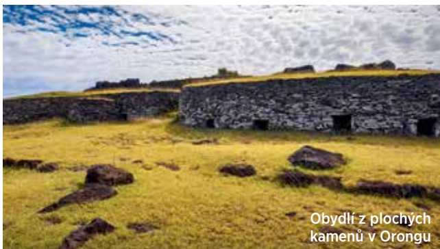
Obydlí z plochých kamenů v Orongu