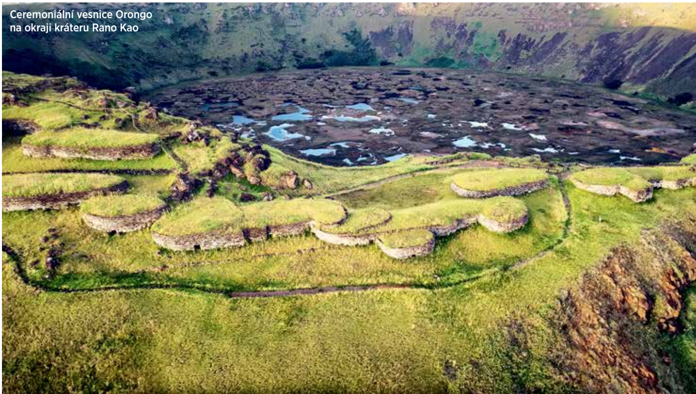
Ceremoniální vesnice Orongo na okraji kráteru Rano Kao