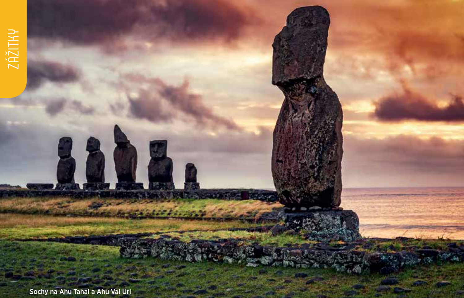
Sochy na Ahu Tahai a Ahu Vai Uri