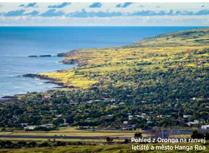
Pohled z Oronga na ranvej letišťe a město Hanga Roa

ním rozeznáváme Tongariki a kráter Rano Raraku, kde jsme byli včera. Je to maličký svět uprostřed Pacifiku.