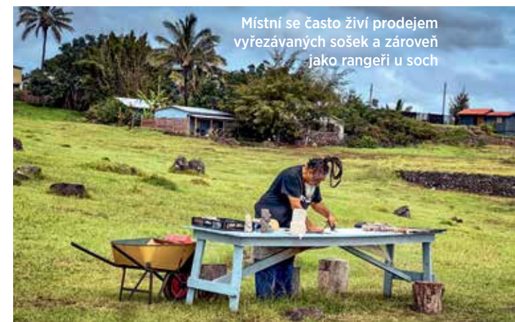
Místní se často živí prodejem vyřezávaných sošek a zároveň jako rangeři u soch

Osobitým a krásným místem na Rapa Nui je Anakena. Jediné místo, kde je na ostrově písčiná pláž a mělký přístup do oceánu. Přímou vybízí ke koupání a tomu samozřejmě neodoláme.