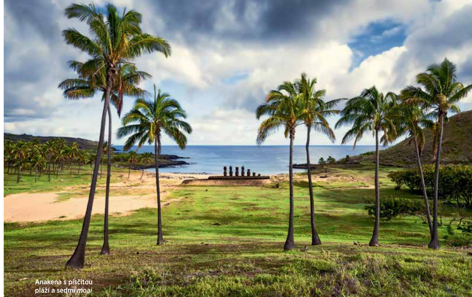
Anakena s písčitou pláží a sedmi moai

Jedním z nejatraktivnějších míst je Tongariki s největším ahu s 15 moai . Leží na východní straně ostrova, jedeme tedy brzy ráno ještě za tmy, abychom na vlastní oči spatřili magický východ slunce. Je to vskutku něco nepředstavitelného. Tongariki má elektrizující atmosféru. Jakmile se na obloze objeví první světlé barevné tóny, ze tmy se začnou vynořovat první siluety moai . Je to strašidelné, kouzelné i přitažlivé zároveň. Do ticha buší zpovzdálí příboj oceánu. Připadám si, jako když Indiana Jones objevuje archu. Ahu Tongariki bylo kdysi zničeno, moai strženy a povaleny na zem. Zkázu dokonala vlna tsunami v roce 1960, která tady sochy odvalila dál od pobřeží. V roce 1996 bylo obnoveno a zrestaurováno