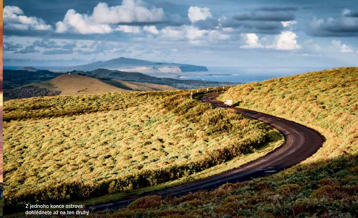
Z jednoho konce ostrova dohlédnete až na ten druhý

Anakena je místem, kam připluli dle legendy první obyvatelé ostrova pod velením krále Hotu Matuy. Jeho žena Vahai tady porodila syna a dala tak život prvnímu člověku Rapa Nui. Tím se Anakena stává místem přímo posvátným. My si užíváme koupání v teplé vodě Pacifiku. Za pláží se tyčí majestátní dominanta, Ahu Nau Nau se sedmi moai , snad nejkrásnějšími na ostrově. Čtyři ze sedmi soch mají na hlavách oranžovohnědé útvary pukao . Dokonalou kulisu dotváří palmový háj, do kterého je Anakena posazená.